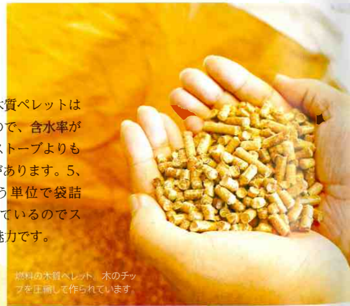
燃料の木質ペレット。木のチップを圧縮して作られています。

種類が使われます。木質ペレットは品質が安定しているため、含水率が低く、燃焼効率は薪ストーブよりも高いというメリットがあります。5、10、15、20kgという単位で袋詰め状態で販売されているのでストックしやすいのも魅力です。