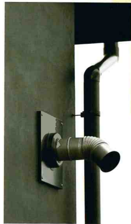
薪ストーブに比べてシンプルなペレットストーブの煙突。

リンカーと呼ばれるケイ素成分の塊が燃焼ポットに付着しやすいので注意が必要です。小まめなメンテナンスは必要であるものの、薪ストーブに比べるとユーザーやストーブ自身が行うことができます。