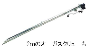
2mのオーガスクレープも標準セット

スマホやPCで遠隔操作、監視出来ます。不具合時のメーカーサポートやソフトのバージョンアップもインターネットで即座に対応。