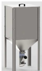
別売のペレットタンク